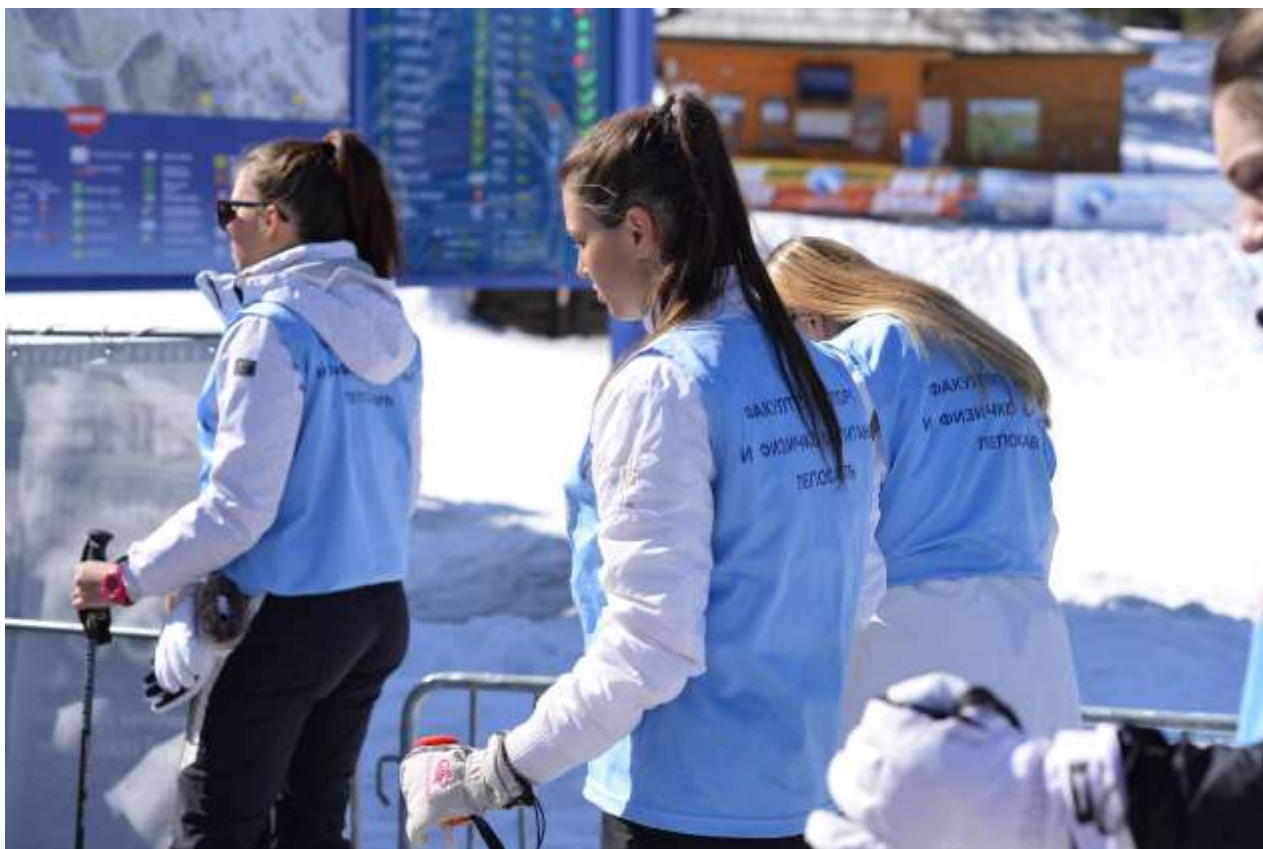
Настава скијања на планини Копаоник