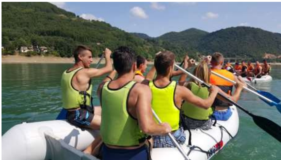
Настава веслања на језеру Газиводе