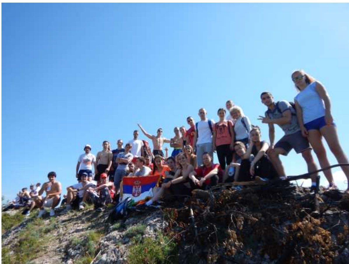
Пешачка тура на планики Копаоник